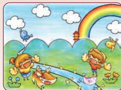
若手実行委員が制作したイメージイラスト